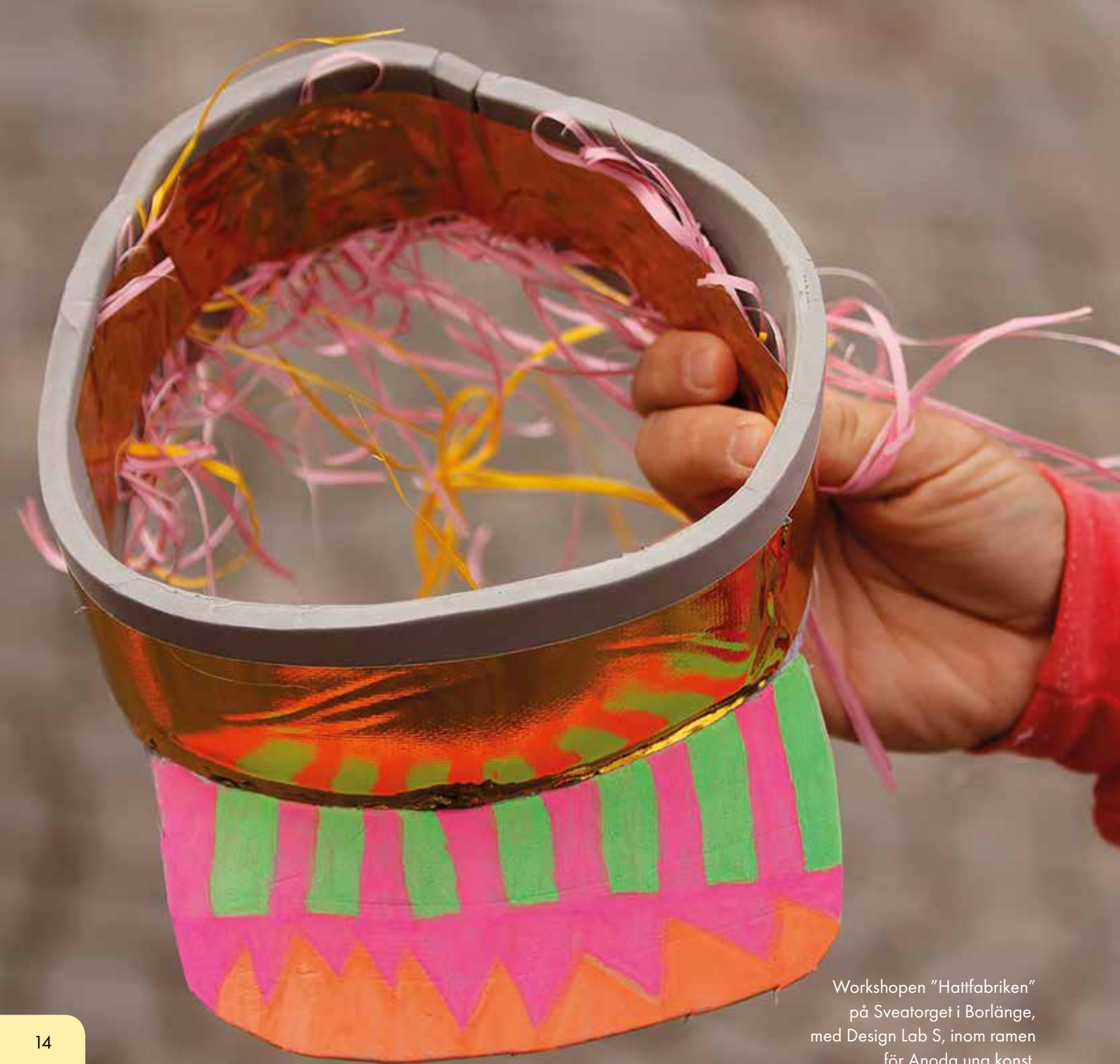
Workshopen "Hattfabriken" på Sveatorget i Borlänge, med Design Lab S, inom ramen för Anoda ung konst.